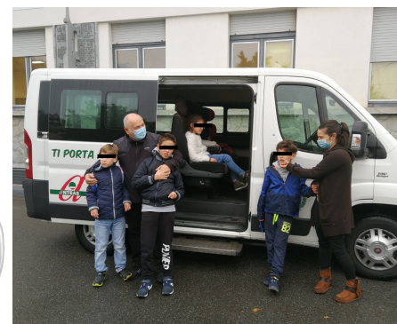
Gruppo Genitori Autismi in Valtellina

Questa lettera di ringraziamento riassume il pensiero di tutte le famiglie che usufruiscono del nostro servizio di accompagnamento nelle varie sedi del "Centro autismo" di Sondrio.